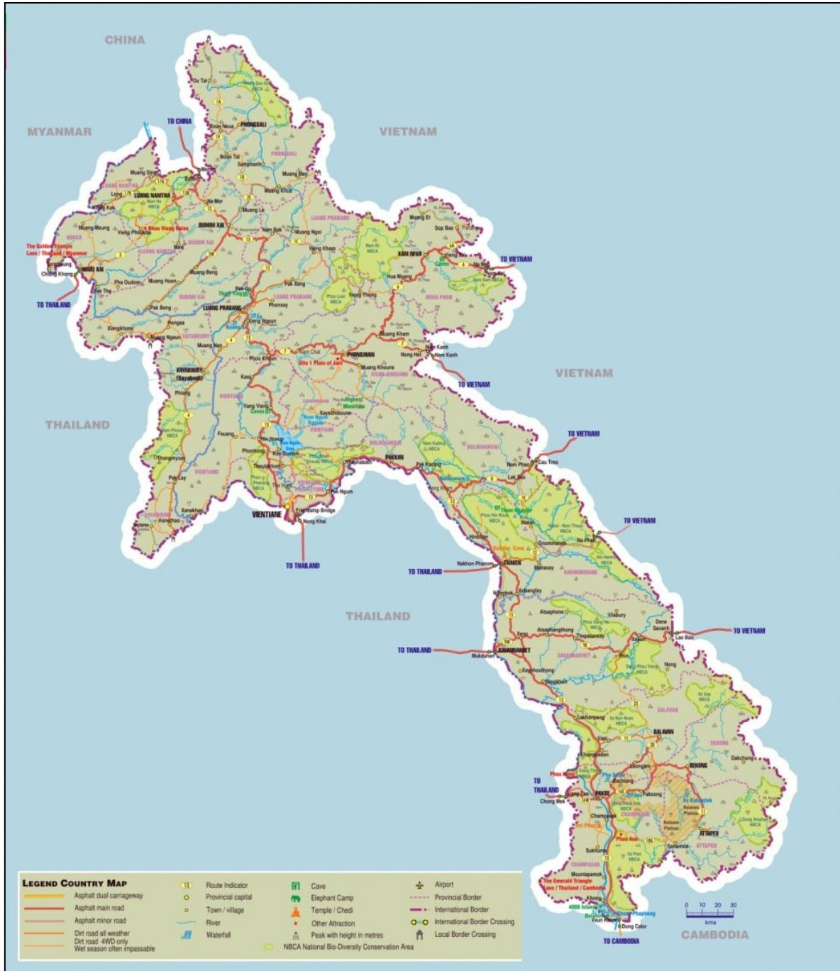
รูปที่ 1.4 เส้นทางคมนาคมใน สปป.ลาว