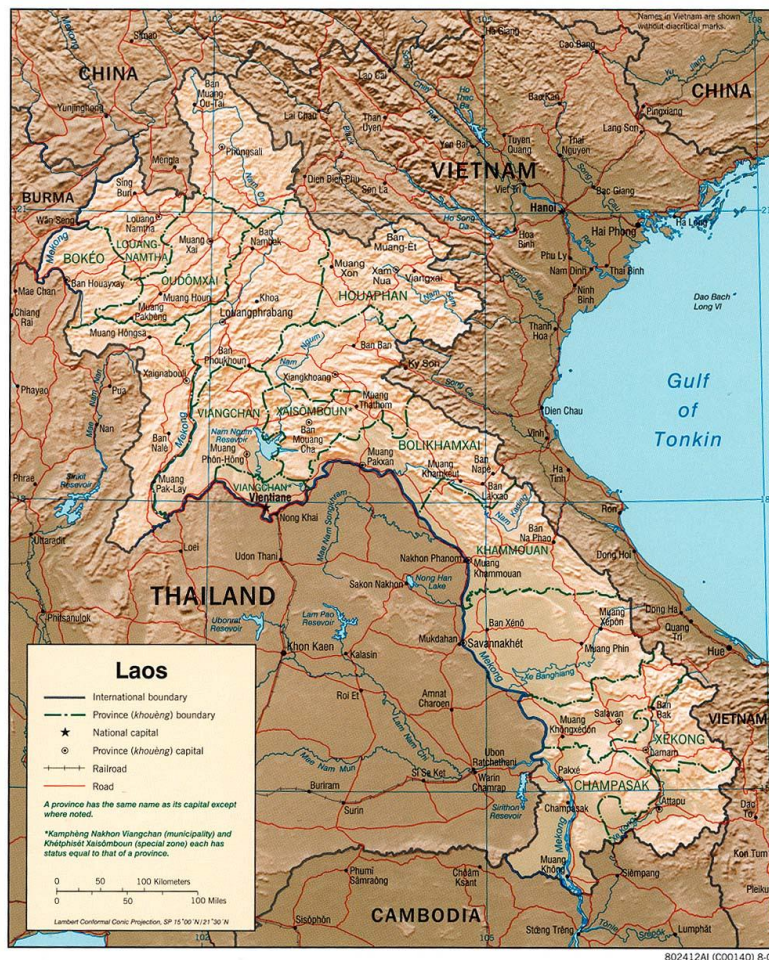
รูปที่ 1.1 แผนที่ภูมิประเทศแสดงตำแหน่งที่ตั้งของ สปป.ลาว

การสำรวจ รวบรวม และทบทวนข้อมูลด้านการจัดหาวัตถุดิบและการลงทุนด้านแร่ของ สาธารณรัฐประชาธิปไตยประชาชนลาว ได้รวบรวมข้อมูลปฐมภูมิและข้อมูลทุติยภูมิเพิ่มเติมที่มีความทันสมัย โดยการรวบรวมข้อมูลที่มีอยู่ในประเทศ จากการค้นคว้าเอกสารและผ่านสื่ออิเล็กทรอนิกส์ ตลอดจนการสัมภาษณ์หน่วยงานที่เกี่ยวข้อง และการเดินทางไปสำรวจรวบรวมข้อมูลในประเทศนั้นๆ โดยตรงผ่านหน่วยงานที่มีการประสานสายสัมพันธ์ไว้