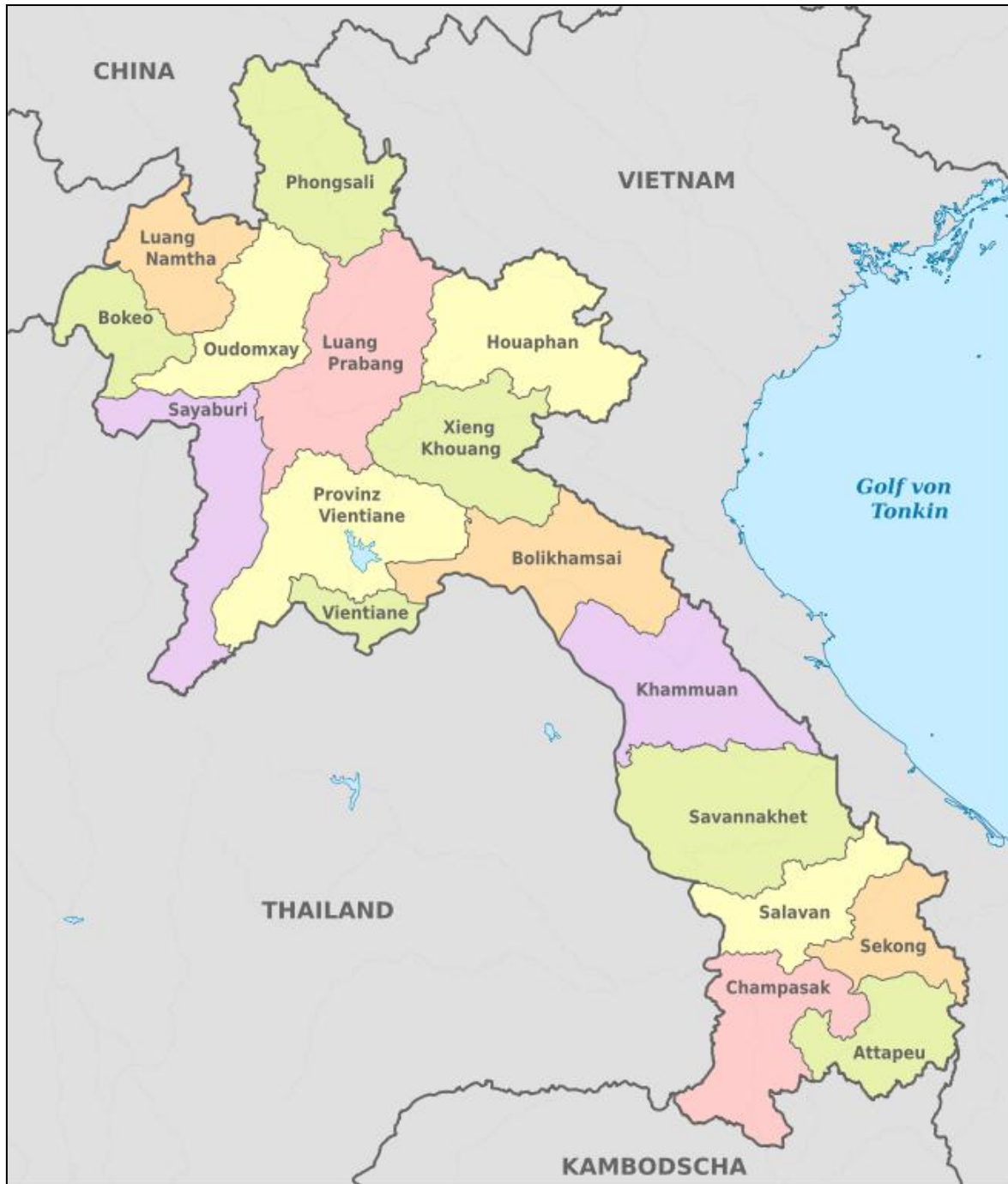
รูปที่ 1.3 เขตการปกครองของ สปป.ลาว