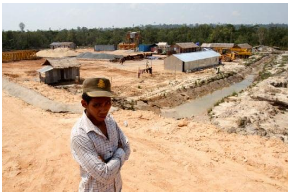
(ที่มา : www.manager.co.th , 2555)

ผู้ที่มีสิทธิในการถือครองที่ดินในกัมพูชา ได้แก่ ผู้ที่มีสัญชาติกัมพูชา และนิติบุคคลที่มีสิทธิ์เสมือนเป็นชาวกัมพูชา ซึ่งได้แก่ นิติบุคคลที่มีชาวกัมพูชาถือหุ้นและมีสิทธิในการออกเสียงร้อยละ 51 ขึ้นไป นักลงทุนต่างชาติส่วนใหญ่นิยมเช่าที่ดินเพื่อการลงทุนในระยะยาว (15 ปี ขึ้นไป) โดยการขอสัมปทานจากภาครัฐหรือการเป็นผู้ครองสิทธิ์รายย่อย (ร้อยละ 49) ในบริษัทที่มีชาวกัมพูชาเป็นเจ้าของ ชาวต่างชาติไม่มีสิทธิถือครองที่ดินตาม