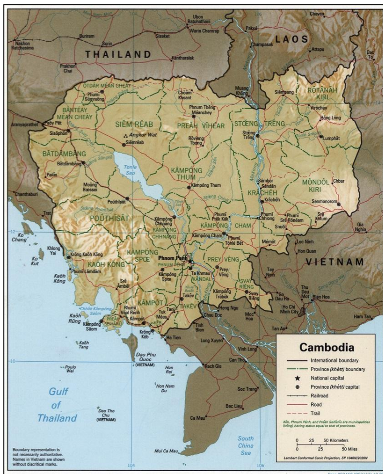
รูปที่ 1.1 แผนที่ภูมิประเทศแสดงตำแหน่งที่ตั้งของประเทศกัมพูชา

การสำรวจ รวบรวม และทบทวนข้อมูลด้านการจัดหาวัตถุดิบและการลงทุนด้านแร่ของประเทศกัมพูชา ได้รวบรวมข้อมูลปฐมภูมิและข้อมูลทุติยภูมิเพิ่มเติมที่มีความทันสมัย โดยการรวบรวมข้อมูลที่มีอยู่ในประเทศ จากการค้นคว้าเอกสารและผ่านสื่ออิเล็กทรอนิกส์ ตลอดจนการสัมภาษณ์หน่วยงานที่เกี่ยวข้อง และการเดินทางไปสำรวจรวบรวมข้อมูลในประเทศนั้นๆ โดยตรงผ่านหน่วยงานที่มีการประสานสายสัมพันธ์ไว้