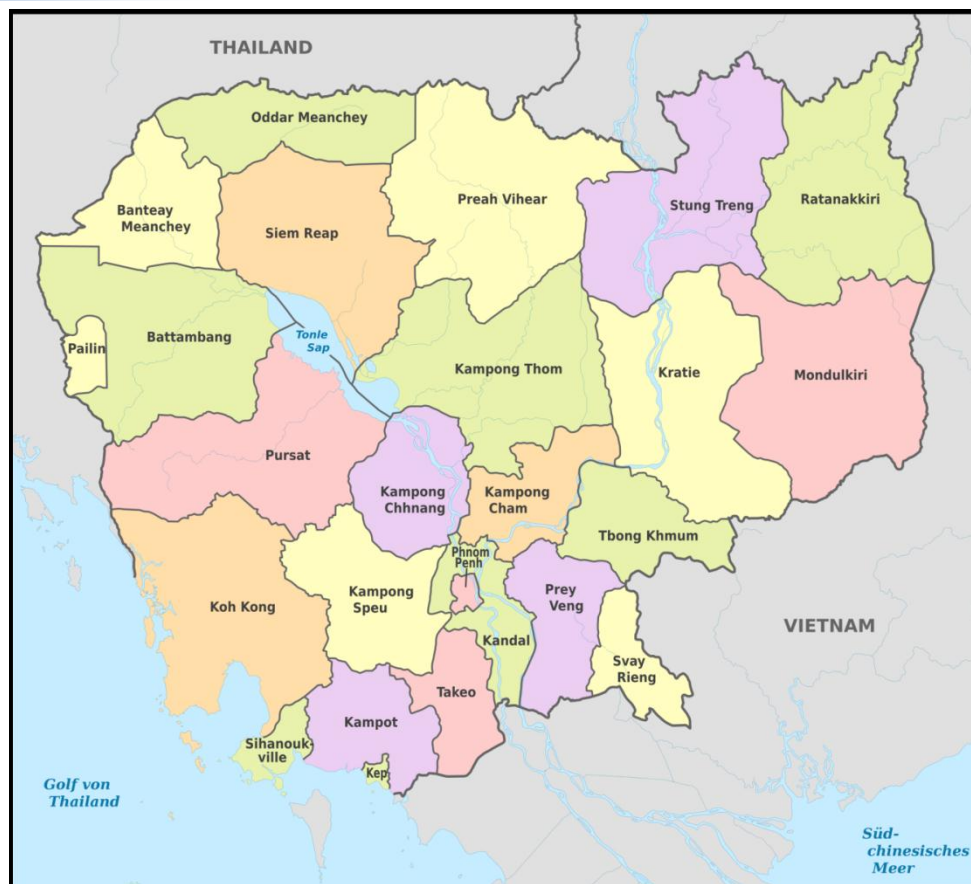
รูปที่ 1.3 เขตการปกครองของประเทศกัมพูชา